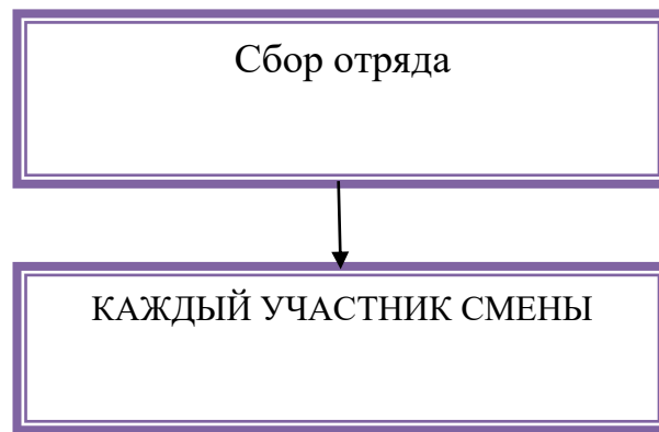
Рис. 1 Организация самоуправления в ДОЛ

Организаторский совет - отвечает за организацию различных мероприятий (одобренных Ученым советом) проводимых на территории ДОЛ.